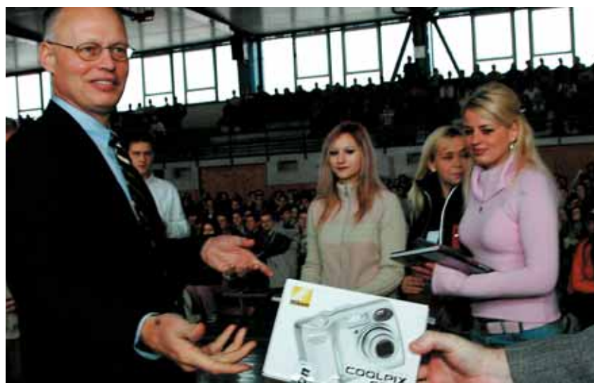
Digitálne fotoaparáty, ochranné pomôcky pre rôzne športy a knihy získalo 24 študentov, ktorí poslali najlepšie práce.

A kým sa hádali, kto skôr nastúpi, vlak zdvihol svoje ťažké železné kolená, trochu zavrtel rušňom, vzdychol si a pomaly sa pobral preč. A tak si na zastávkach dodnes nadávajú stále nejakí ľudia, nejakí stále nevedia, koho skôr