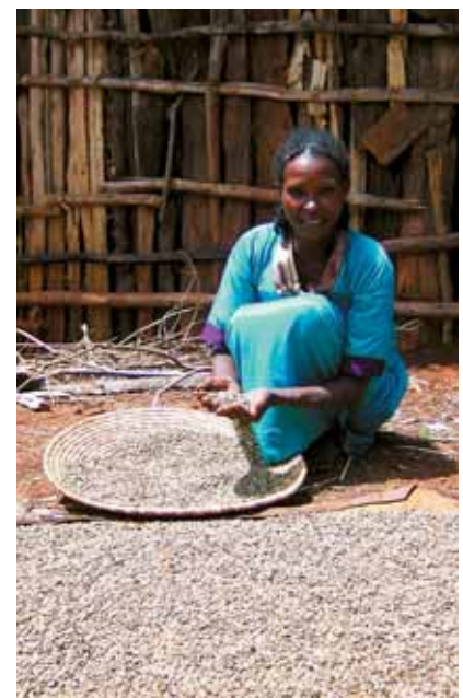
triedenie kávových zŕn v Etiópii

Pri rôznych príležitostiach môžete darovať firemný darček, ktorý spĺňa fair trade princípy. Týmto nielen podporíte dobrú myšlienku, ale namiesto štandardného priemyselného produktu z katalógu potešíte svojich zákazníkov, obchodných