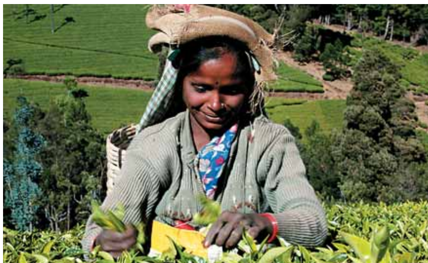
zber čajových lístkov v Indii