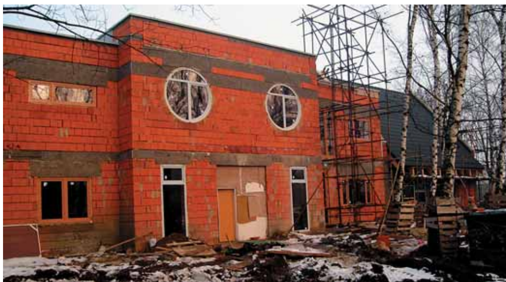
Aktuálny stav výstavby hospicu a vizualizácia jeho plánu

„plúca mesta“ a berieme deťom právo na život v zdravom životnom prostredí. Znova nás napádali, že pohľad na utrpenie môže spôsobiť deťom psychickú ujmu. Mnohé tieto argumenty mali svoj pôvod v neinformovanosti obyvateľstva a v strachu pred neznámym, ktorým u nás hospic bol. Začali sme intenzívnejšie pracovať s verejnosťou, vysvetľovať im odbornú aj ľudskú stránku hospicu a jeho nesmiernu potrebnosť. Svojimi vyjadreniami nás podporili viaceré známe osobnosti, pomohli nám vyjadrenia odborníkov a ľudí, ktorým sme pomohli pri zvládaní choroby a ktorí sami intenzívne cítili potrebu hospicu. Vďaka viacerým akciám sa nám podarilo získať verejnú mienku na našu stranu a po zdolaní ďalších administratívnych prekážok sme mohli začať stavať. Pomáhala nám vzájomná morálna podpora, pomoc ľudí, niekedy úplne cudzích, okolo nás, prejavy solidarity a samozrejme viera, že sme spolutvorcami potrebného diela pre ľudí.