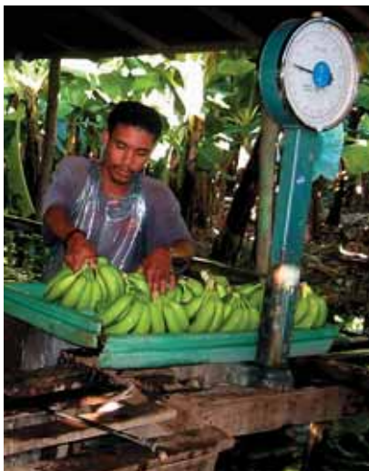
váženie banánov v Dominikánskej republike

Centrum environmentálnej a etickej výchovy Živica ( www.zivica.sk ), Centrum environmentálnych aktivít Trenčín ( www.cea.sk , www.biospotrebiteľ.sk ), Človek v ohrození ( www.clovekvoohrozeni.sk ), Ekumenická rada cirkví na Slovensku ( www.ekumena.sk ), FairTrade Slovakia ( www.fairTrade.sk ), Nadácia Integra ( www.integra.sk ), Platforma mimovládnych rozvojových organizácií ( www.mvro.sk ).