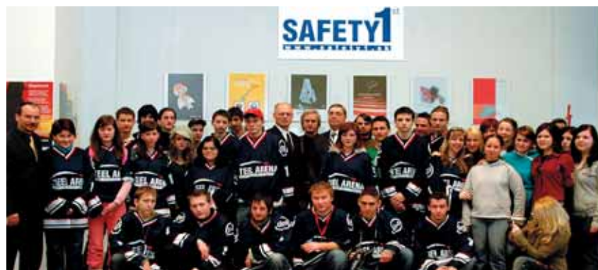
Spoločná fotografia študentov Filmovej školy v Košiciach na záver vernisáže výstavy najlepších prác študentov umeleckých škôl.