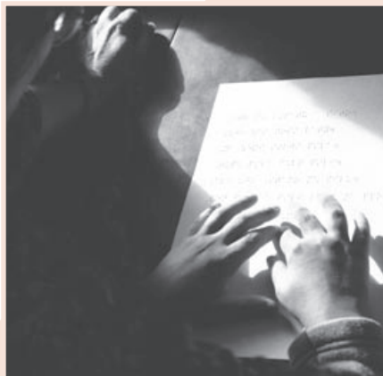
autor: Martin Havran