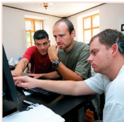
autor: Pavol Fumtál