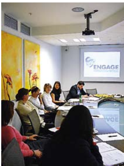
Zakladajúce stretnutie Engage 22. februára sa na ňom zúčastnili zástupcovia deviatich firiem

Engage je cestou, ako podporovať komunitu nielen jednorazovými finančnými grantmi, ale strategickejšou priamou pomocou prostredníctvom vynaloženého úsilia a s využitím zručností zamestnancov. Firmy združené v Engage sú presvedčené, že práca zamestnancov v prospech komunit prináša benefity tak pre ich okolie, ako aj pre firmy samotné. Zamestnanci cítia, že firma podporuje dobrú myšlienku, vnímajú vykonané prospešné veci a oceňujú prístup k ich aktivitám vo voľnom čase. Firma dobrovoľníckymi aktivitami potvrdzuje svoje miesto v spoločnosti, prejavuje svoju spoločenskú zodpovednosť a ukazuje, že pre svoje okolie je dobrým susedom, čo má priaznivý dopad aj na jej podnikanie a vzťahy s klientmi.