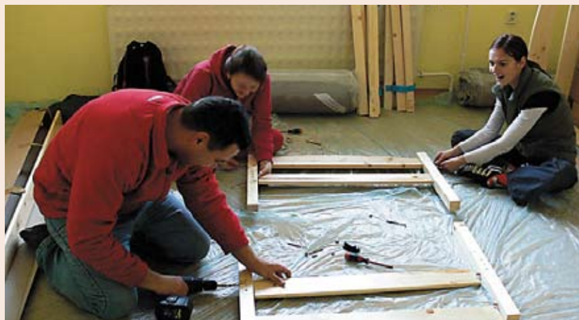
Dobrovoľníci zo spoločnosti Orange Slovensko strávili dve soboty pomocou krízovému centru Slniečko

Spoločnosti Slovak Telekom, a. s. a Orange Slovensko, a. s. pravidelne organizujú dobrovoľnícke dni pre svojich zamestnancov v krízovom centre Slniečko, ktoré pomáha týraným, zneužívaným a zanedbávaným deťom a obetiam domáceho násillia – matkám s deťmi a ženám. Posledného dobrovoľníckeho dňa spoločnosti Slovak Telekom sa v decembri zúčastnilo 15 zamestnancov spoločnosti a ich rodinných príslušníkov. Cieľom ich návštevy bolo pripraviť pre deti mikulášsky program, pomôcť pri výrobe vianočných pozdravov a napiecť vianočné pemiky. V rámci dobrovoľníckeho dňa spoločnosti Orange v poslednú februárovú sobotu 13 dobrovoľníkov pomáhalo upraviť toto centrum tak, aby sa týrané deti alebo ich mamy v ňom cítili lepšie.